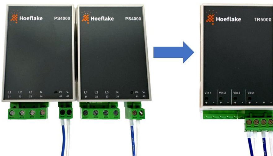
Figuur 2, 'Oude' PS4000 links, nieuwe TR5000 rechts

Bij het vervangen van de voeding is het niet nodig om werkzaamheden te verrichten aan de bestaande 24Vdc bedrading en aansluitingen. De aansluitstekker is hetzelfde gebleven en kan zo omgestoken worden op een van de V_{out} aansluitingen: